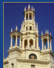
Casa del Chavo